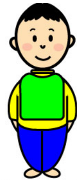
えぷろんをします