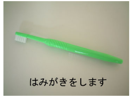
はみがきをします