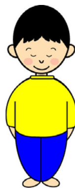
ありがとうございました